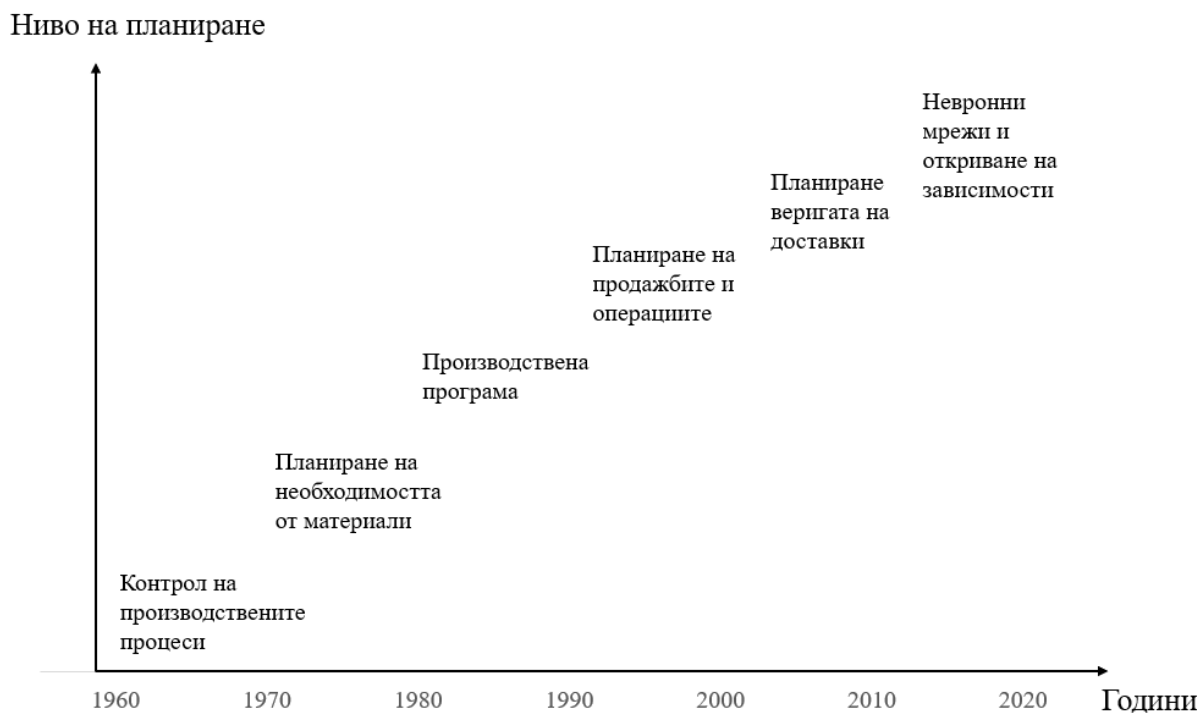
Фигура 1. Еволюция в нивото на планиране на процесите в предприятието

Всеки един от тези етапи е предпоставка за оптимизиране на дейността на предприятията, водещи до ERP системите, които имат за цел не само да обхванат цялостната дейност на предприятието, да обобщят данните от всички звена, но и да представят целия набор от конфигурирана информация по достъпен начин, който да гарантира обезпечаване на потребностите на управленския персонал.